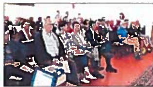
Cda risultati soddisfacenti

mila euro. "Il bilancio sociale, cui sono stati destinati 429mila euro, attesta inoltre un impegno accresciuto". Da dove vengono questi risultati positivi? "La prima parte del 2015 afferma il presidente - ha registrato una forte incidenza di patologie influenzali. Ma, soprattutto, ritengo che si riveli efficace la strategia di puntare con decisione su programmazione e controllo. L'anno scorso il cda si è riunito 30 volte, ben oltre le 12 previste dallo statuto". Quanto al 2016, se "si è subito preannunciato come