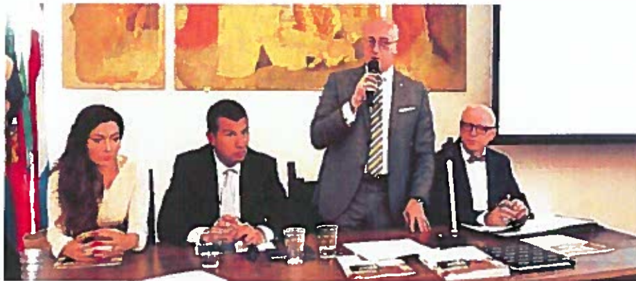
I vertici di Afas hanno presentato ieri i numeri del 2015 e il piano per il futuro