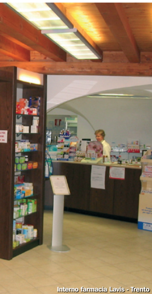
Interno farmacia Lavis - Trento

un'immagine nuova al cittadino affinché comprenda la convenienza di continuare a rivolgersi alla farmacia invece di scegliere il sistema della grande distribuzione. Per il sistema delle farmacie pubbliche è davvero il momento e l'opportunità giusta per affrontare e superare alcune divisioni e visioni del passato a vantaggio di una migliorata capacità logistica e competitiva. Risultati a livello strutturale e gestionale da ottenersi iniziando a lavorare seriamente e con celerità sul mutamento culturale, per dare un senso nuovo alla presenza delle strutture farmaceutiche sul territorio, per operare con convinzione attraverso uno standard uniforme e di elevata qualità nei servizi. Si tratta di sostenere l'avvento di una logica nuova che impone di fare sistema, di attrezzarsi per affrontare una nuova esperienza, poiché rimanere immobili significherebbe solamente subire l'aggressione competitiva da parte della grande distribuzione. Una sfida da cogliere per Assofarm Servizi e per le farmacie pubbliche chiamate a consolidare un percorso appena iniziato sotto i migliori auspici.