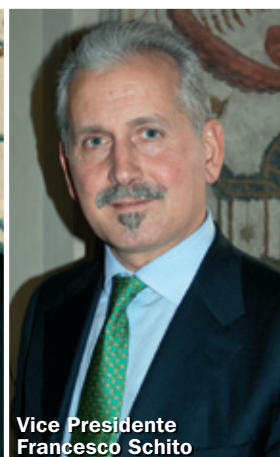
Vice Presidente Francesco Schito

si sta considerando l'opportunità di costituire dei gruppi d'acquisto per permettere alle farmacie di creare un vero sistema a rete, ma soprattutto di sostenere un percorso di economia di scala per rispondere al meglio